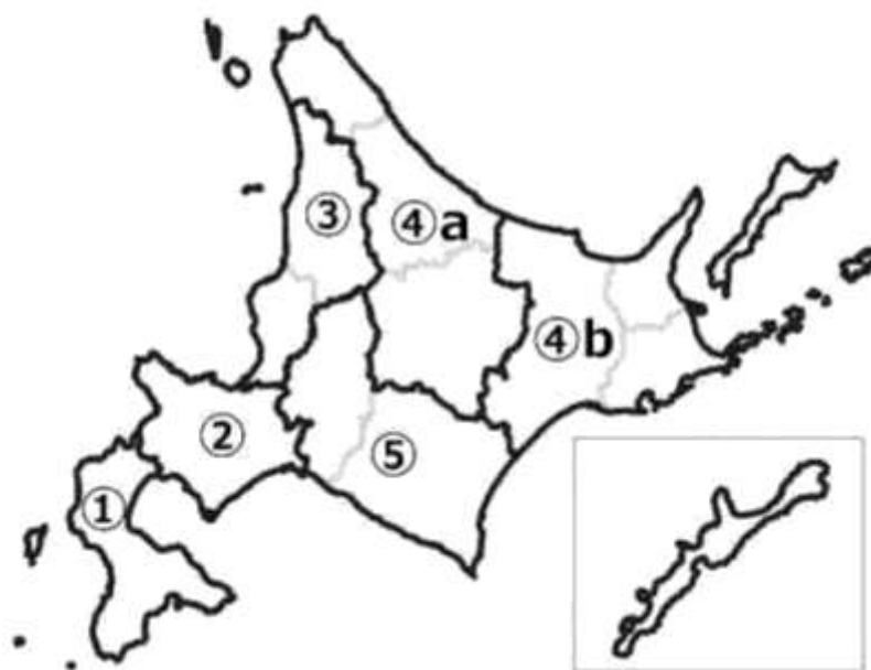
【表 1 計画対象地域の地域区分の概要】(別冊参考資料編参照)